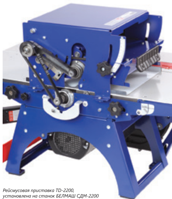
Рейсмусовая приставка TD-2200, установлена на станок БЕЛМАШ СДМ-2200

Приставка рейсмусовая, ограждение ремня, ремень, шаблон, ключ, кожух для удаления стружки, крепёж, руководство по эксплуатации, упаковка.