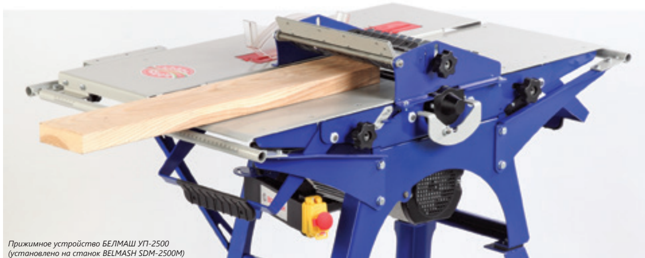
Прижимное устройство БЕЛМАШ УП-2500 (установлено на станок BELMASH SDM-2500M)