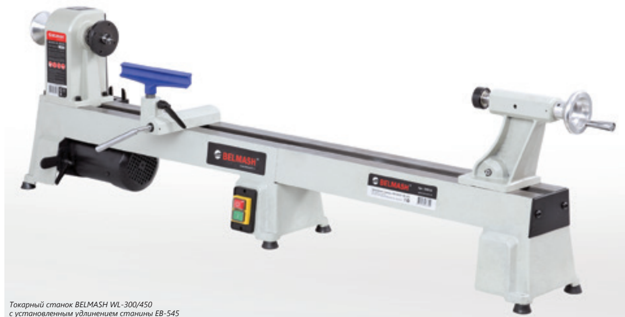
Токарный станок BELMASH WL-300/450 с установленным удлинением станины EB-545