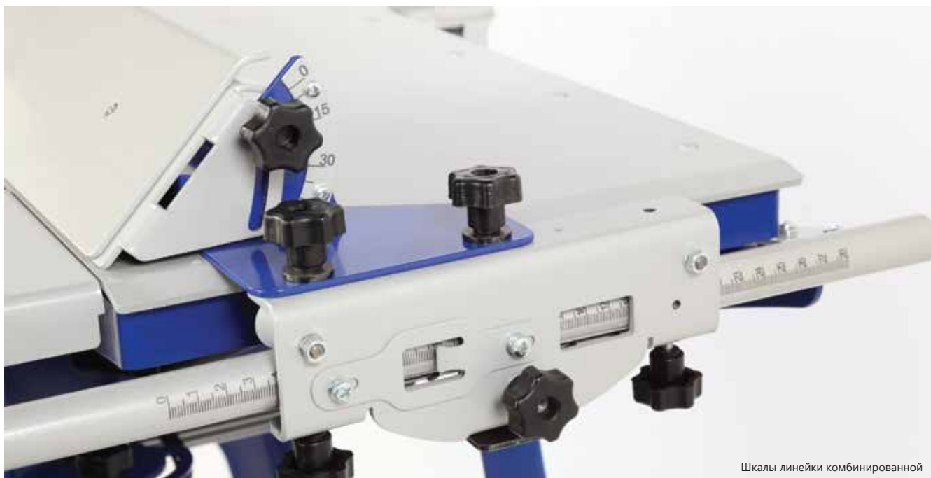
Шкалы линейки комбинированной